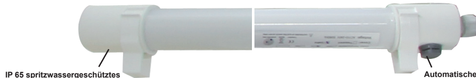
IP 65 spritzwassergeschütztes Gehäuse